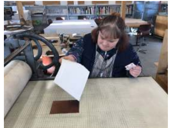
Tiefdruck-Workshop mit der Heilpädagogischen Schule Uster