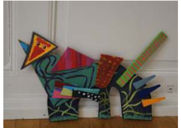
„En buntä Huufe“, Vernissage in der Villa Grunholzer