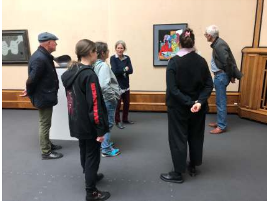
Kunstmuseum Winterthur Rundgang durch die Sammlungsausstellung.